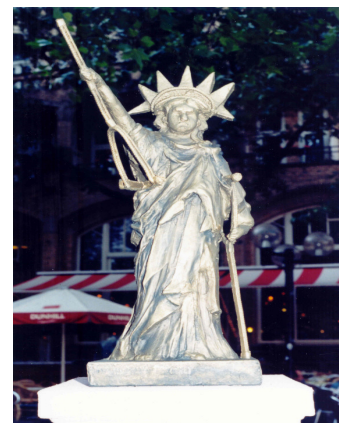
Mobilisons nous pour nos droits!

Venez en nombre pour faire en sorte que le handicap ne soit plus un handicap!